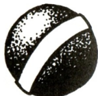
BOLA DE CRICKET